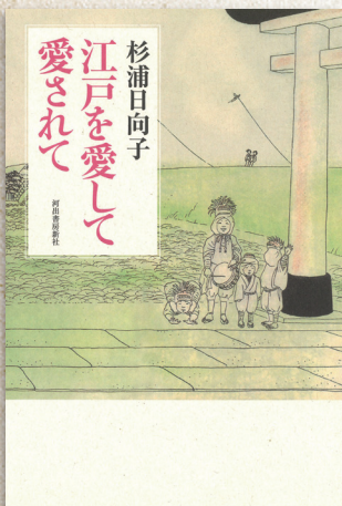
「江戸を愛して愛されて」河出書房新社