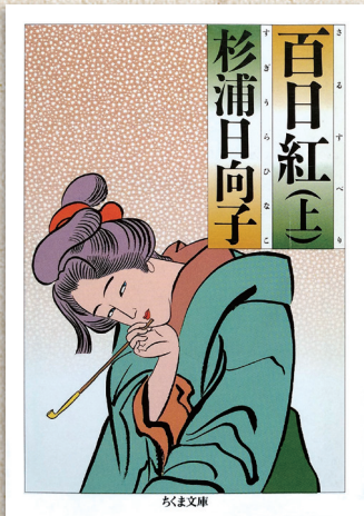
「百日紅」ちくま文庫