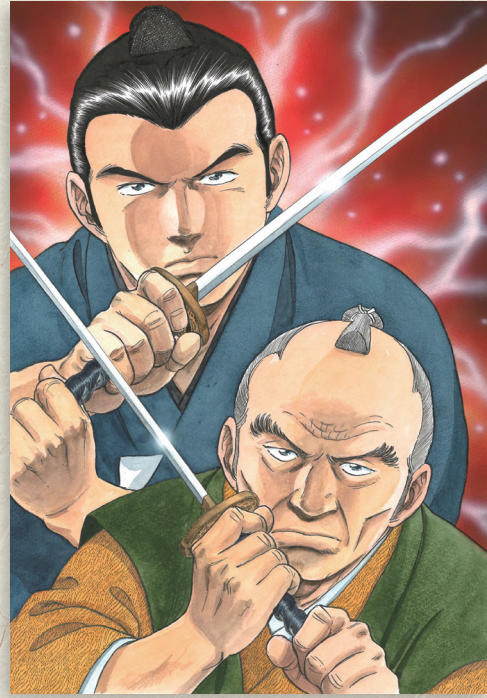
「剣客商売」大島やすいち 原案 池波正太郎 (リイド社)