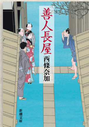
「善人長屋」西條奈加 (新潮文庫)