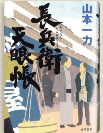
「長兵衛天眼帳」山本一力 (角川書店)