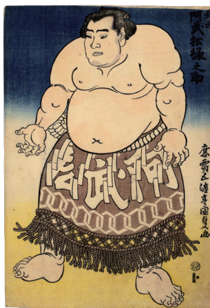
第6代横綱 阿武松緑之助