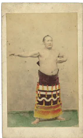
第12代横綱 陣幕久五郎