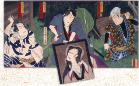
「四ツ谷怪談 戸板返之図」豊原国周 画