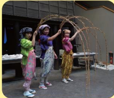
【出演】日本大道芸・大道芸の会

江戸の人々の暮らしを支えた様々な物売りや、 街角を賑わせた大道芸を再現します。季節限定の物売りや人気の「玉すだれ」を解説付きでお楽しみください。