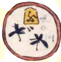
深川 (歩・蚊・蚊に濁点・輪)