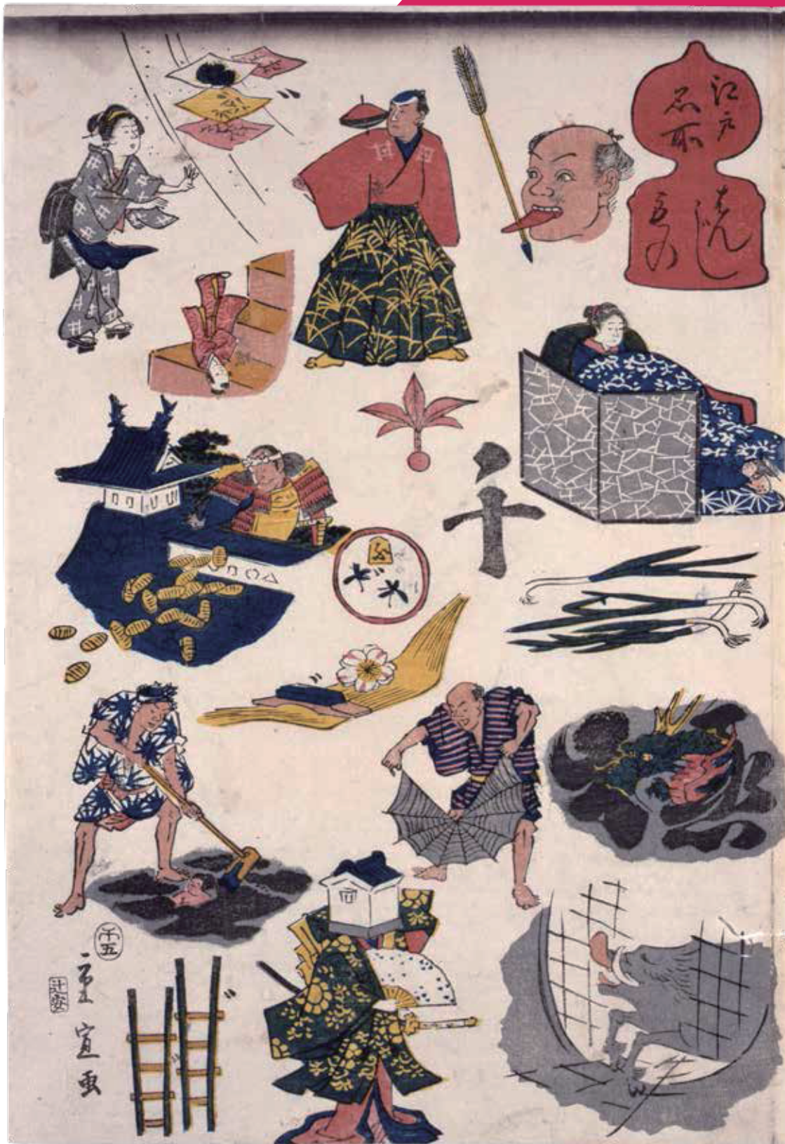
「江戸名所はんじもの」歌川重宣