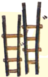
日本橋 (上半分の二本の梯子に濁点)