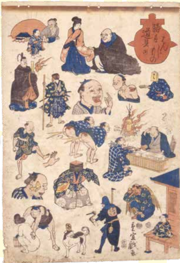
「勝手道具はんじもの」歌川重宣