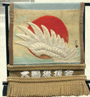
川端龍子意匠の化粧廻し