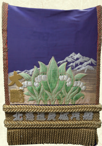
「北海道炭鉱汽船」から贈られた化粧廻し