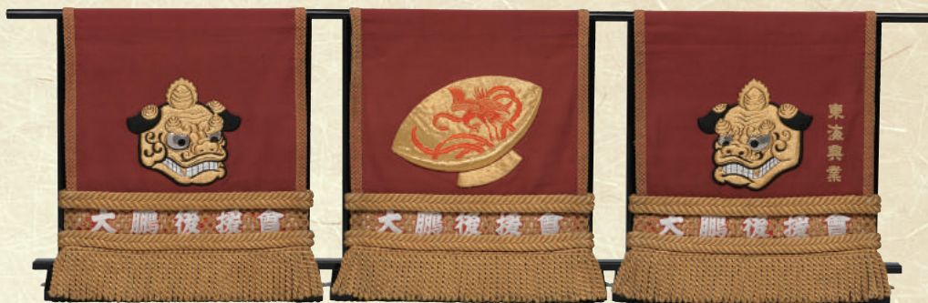
化粧廻し「獅子頭と盃」