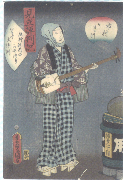
見立評判記_市村かきつ (深川江戸資料館蔵)