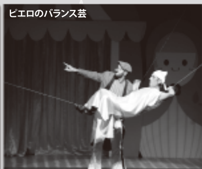
ピエロのバランス芸