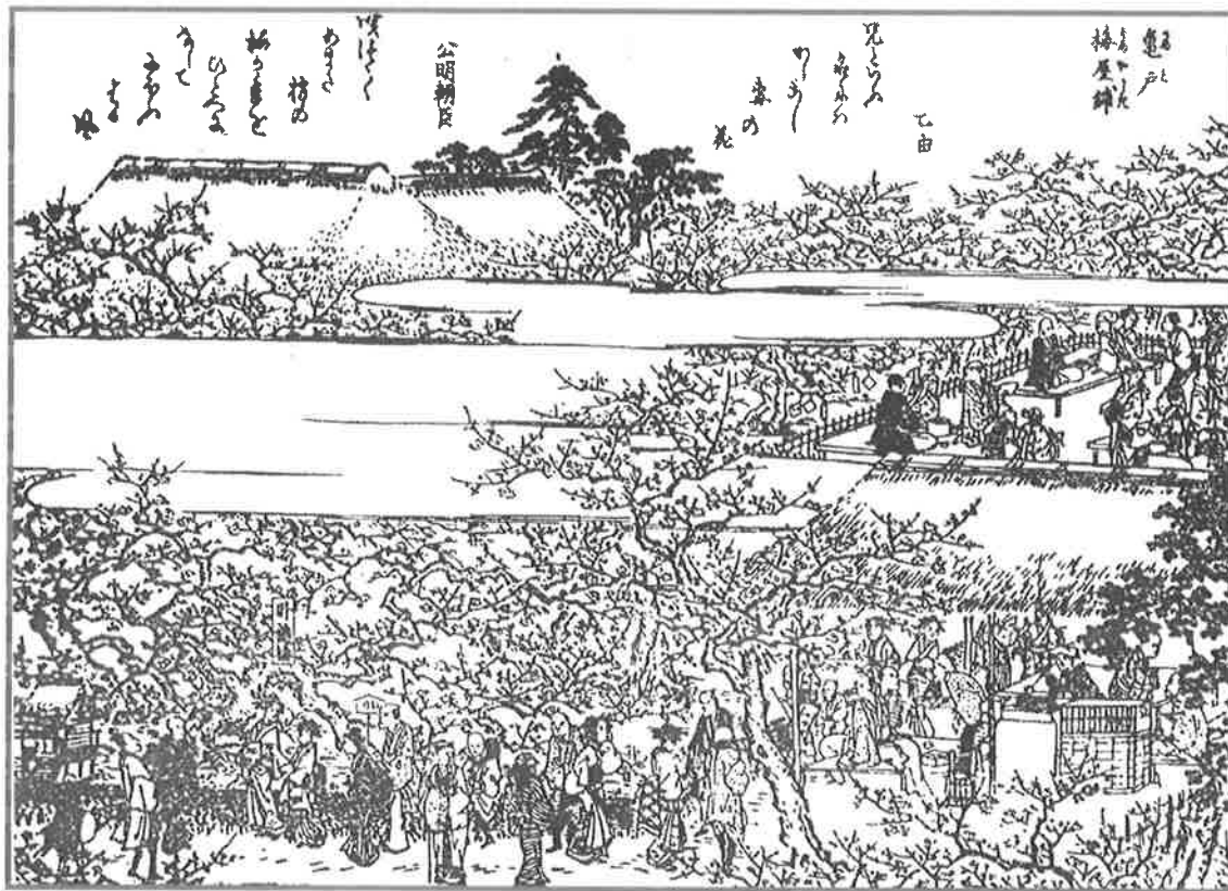
『江戸名所花暦・亀戸梅屋敷』

梅は1年で最初に開く花ということから、「梅は百花の先駆け」といわれ、江戸に春の訪れを告げていました。江戸の人々は桜と同様に梅を愛でていましたが、特に文学をたしなむ人の間で、梅が鑑賞され和歌・俳句をはじめさまざまな作品に登場しました。