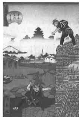
『本所堅川通り景』歌川広景画 館蔵

【木場へ通じる いのほり 亥ノ堀】元禄14年(1701)、木場の移転に伴い、大横川は小名木川と交差して南に延伸しま