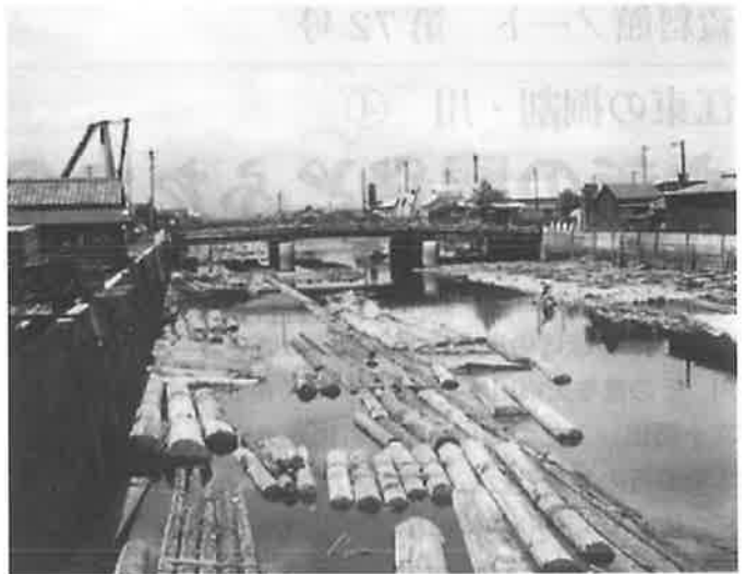
昭和30年(1955)大横川 江東区教育委員会蔵 木場の材木堀から、本所・豎川方面へ続きます。たくさんの材木が水面に浮かび、木場内の情景のようです。

大横川の川幅が20間なのに対し、川幅10間(約18m)であったため、この名がつけられました。大