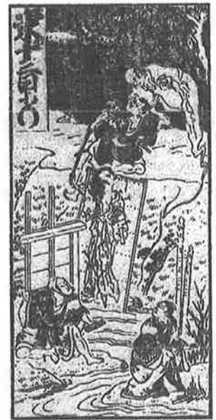
『中村座 狂言番附』(文政十亥年九月)(河竹繁俊校訂『東海道四谷怪談』)

*本文中には差別的表現と受け取れる用語が含まれていますが、ここでは学術的な立場からの見解を述べるために引用・使用しています。