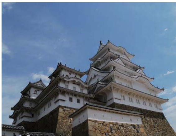
世界遺産・姫路城