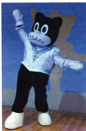
『白鳥の湖』ジークフリート王子をイメージした衣裳。オデットと早く共演したいのらくろ。のらくろ王子の舞台デビューをお楽しみに！