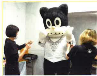
衣裳製作は、東京シティ・バレエ団衣裳部。手作業で行う胸元の装飾など、本格的な仕様で作っていただきました。