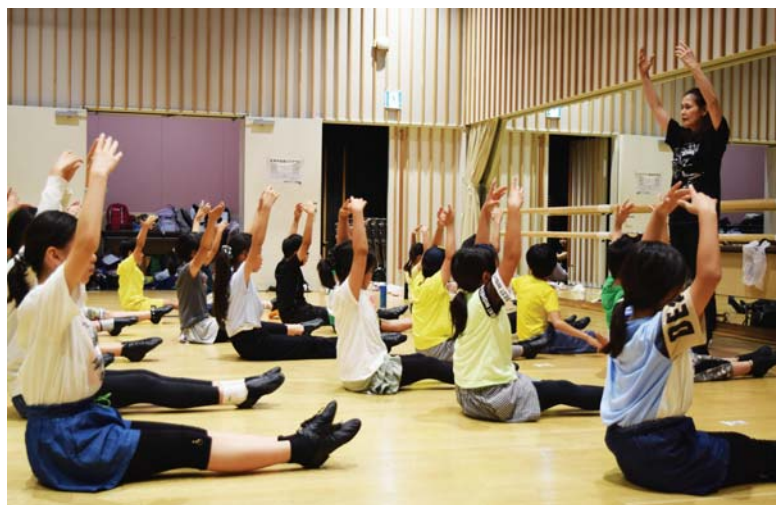
レッスンの様子(イメージ)