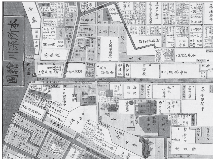
「本所深川絵図」(部分) 安政5年(1858) 館蔵

潮の干満による水位の変化はありますが、どちらの方向からどちらの方向へ向かって流れているのか、というのは難問です。ほとんど流れていません。しかし、河川法（法律）上は、荒川水系の一河川として位置づけられているため、荒川側を上流、隅田川側を下流と呼ぶことになっています。「右岸」「左岸」という表現を用いる場合は、上流方向から下流方向へ向かって右・左を見ます。北岸の大島・猿江・森下・高橋・常盤を右岸、南岸の東砂・北砂・扇橋・白河・清澄を左岸と呼ぶことになります。現在は、「北岸」「南岸」の表現を用いることが多いので、混乱することはないと思いますが、小名木川のエピソードのひとつとして、念頭に置いておくとよいでしょう。