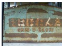
八名川に残る旧新大橋名板