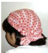
おしゃれな帽子としても

古代、布は非常に高価だったため神祭具など限られた用途に使われました。鎌倉時代以降、庶民にも普及し始め、室町時代には浴用に、戦国時代には広く用いられるようになります。江戸時代頃から「てぬぐい」と呼ばれ、おしゃれアイテムとしても利用され、用途を広げていきました。