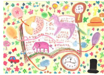
「物語の世界へ」 さくらもち