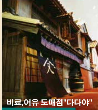
비료,어유 도매점 "다다야"