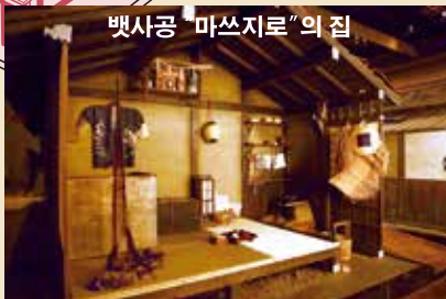
뱃사공 "마쓰지로"의 집