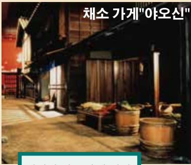
채소 가게 "야오신"