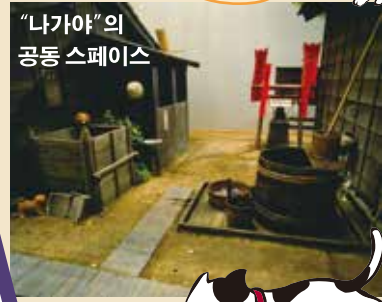
"나가야"의 공동 스페이스