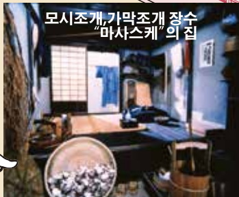
모시조개,가막조개 장수 "마스스케"의 집