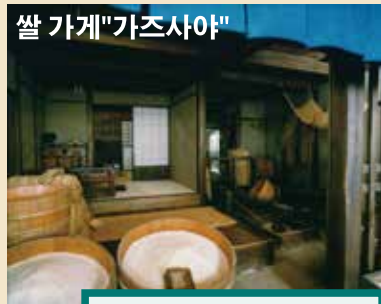
쌀 가게 "가즈사야"

쌀도매점에서 쌀을 사들여 서민에게 판매합니다. '당구(발로 찢는 발방아)'라는 기계로 정미합니다.